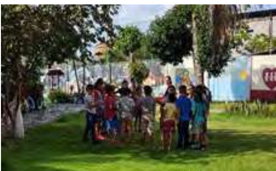
Centro Social “Grande Victoria” Fundação Fé e Alegria Unidada Manaus

La Fundación Fé y Alegría, en Manaus, ordinariamente centra su trabajo con la población migrante de estados como Pará, Maranhao y Ceará, colonos en la configuración de la comunidad Grande Victoria. Sus actividades forman parte de la línea de trabajo nro. 2 (Educación Ambiental) y se desarrollan para promover la integración escuela-familia-comunidad, en el diseño, implementación y mantenimiento de huertos familiares como aportes a la economía familiar y reducción en el uso de agroquímicos.