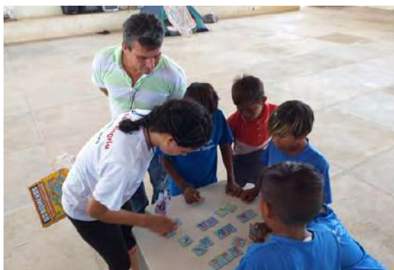
Perfil migratório venezuelano e demandas por políticas públicas