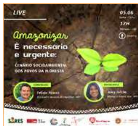
Live: Amazônizar é necessário e urgente