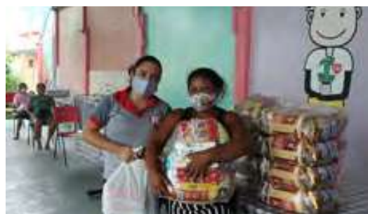
Entrega de ayuda humanitaria Centro Social “Grande Vitória”

Devido ao contexto de pandemia, em 2020 as atividades passaram a ser em caráter não presencial, por meio de interação virtual e encontros pontuais para doações de alimentos e produtos de higiene, necessidades básicas do público atendido.