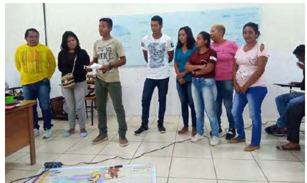
Programa de Formación para líderes indígenas año 2019. Los indígenas ratifican sus demandas en educación tradicional y formal.

http://ufr.br/ppgsof/index.php/downloads/category/28-livros.html