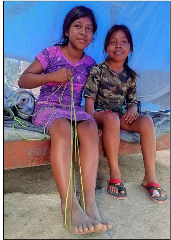
Foto de niñas indígenas Karinãs Aprendiendo a tejer el chinchorro.

a tejer los chinchorros. “Nosotros no tuvimos la oportunidad de aprender en Venezuela, en parte porque tuvimos que ir a la ciudad y ahí comenzamos a estudiar y a perder interés en aprender a hacer los chinchorros. Ahora estamos aprendiendo y puede ser una oportunidad para generar ingresos produciendo algo con nuestros conocimientos de indígenas kariña”.